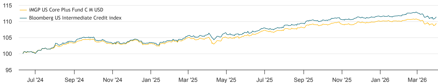
Past performance does not predict future returns. Returns may increase or decrease as a result of currency fluctuations for non-USD investors.