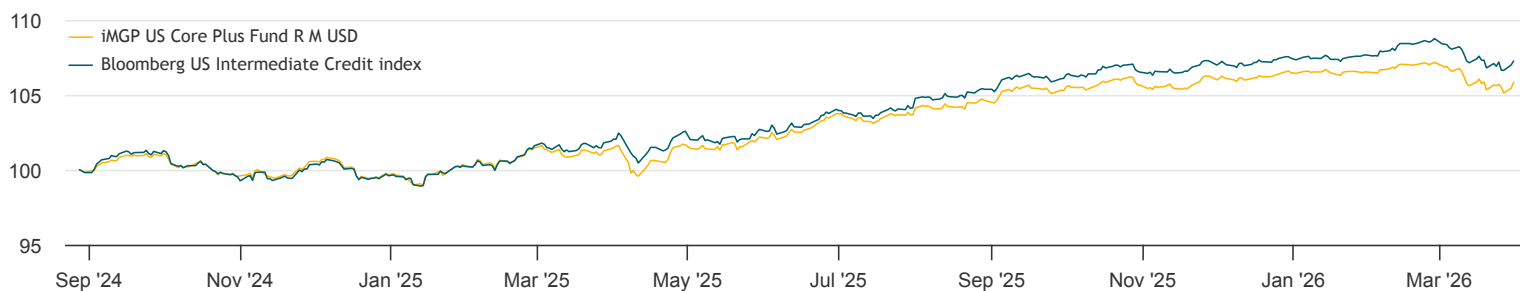
Past performance does not predict future returns. Returns may increase or decrease as a result of currency fluctuations for non-USD investors.